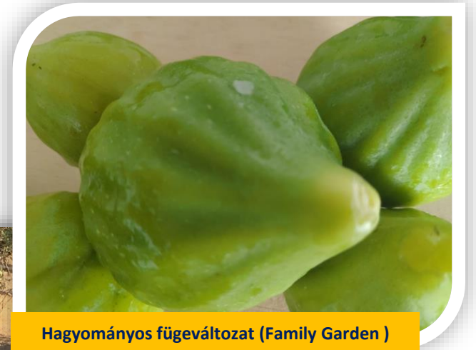
Hagyományos fügeváltozat (Family Garden )

B) RÉGI TÁJKULTÚRA VAGY GAZDÁLKODÁSI RENDSZER pl. olyan legelő, mely lehetővé teszi a vadbika vagy az ibériai sertés fajtáinak fennmaradását.