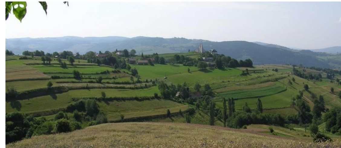
Egy hagyományos mezőgazdasági táj látképe Hriňová környékén (Közép-Szlovákia).

F) Az agroerdészeti rendszerhez kötődő VADON ÉLŐ NÖVÉNY- ÉS ÁLLATVILÁG.