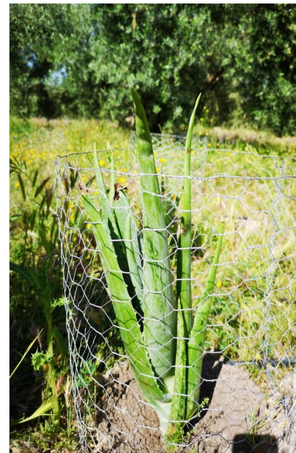
Példa a jövedelem növények társításával történő diverzifikálására egy aloe vera – olajfa agroerdészeti rendszerben

GAZDASÁGI FUNKCIÓK: növelik a hozamot és további bevételi forrásokat biztosítanak, így a növények és másodlagos termékek további értékesítésével növelik a gazdálkodók és a földtulajdonosok nyereségét. Közbenső jövedelemre számíthatunk, pl. gyümölcsfajok telepítése esetén, vagy tűzifa eladásából, kosarak készítéséből, stb.