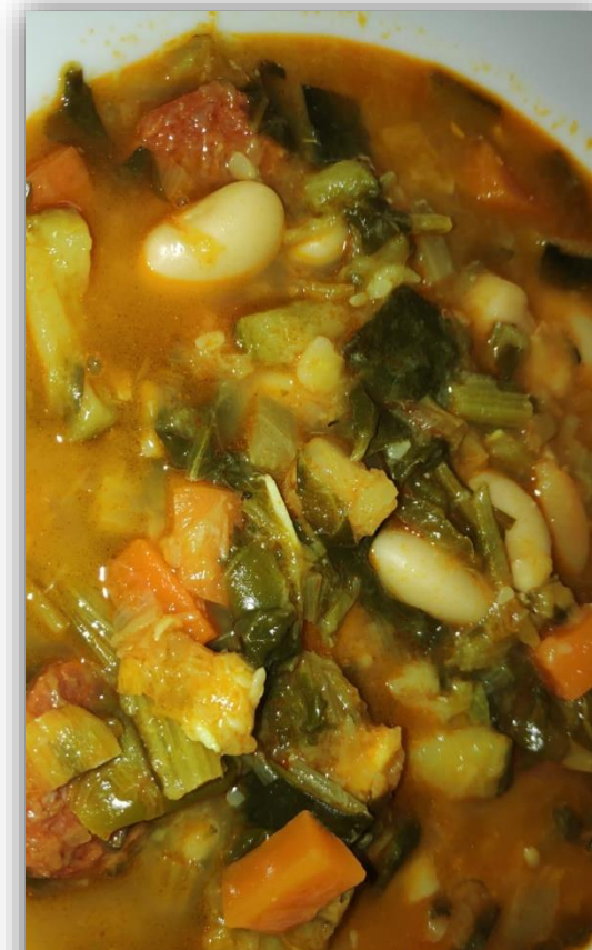
Hagyományos egytálétel kerti zöldségekkel (pl. mángolddal) és toros kolbászal

F) Az agroerdészeti rendszerekhez kötődő GASZTRONÓMIA .