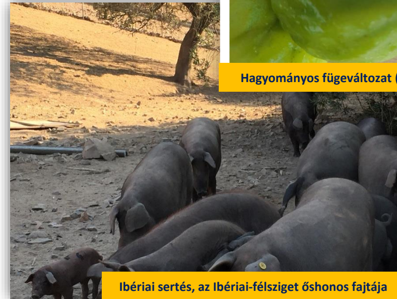
Ibériai sertés, az Ibériai-félsziget őshonos fajtája