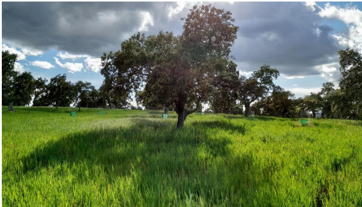
Szántóföldi agroerdészet, ökológiai rendszerű legelő és gabonatermesztés