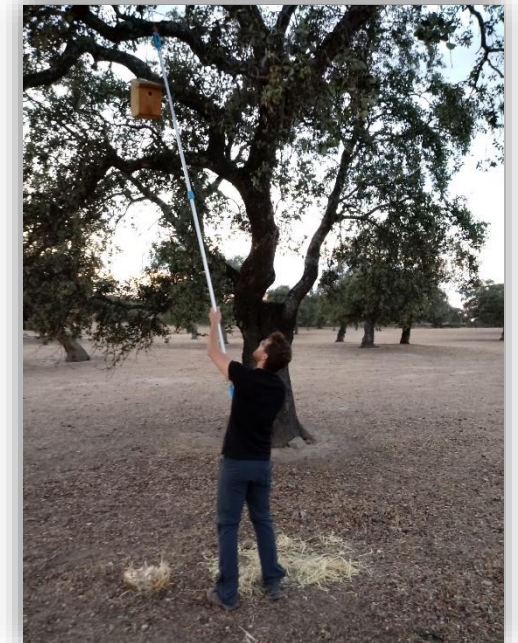
Fészkelőodú kihelyezése egy fás legelőn a biodiverzitás védelme érdekében