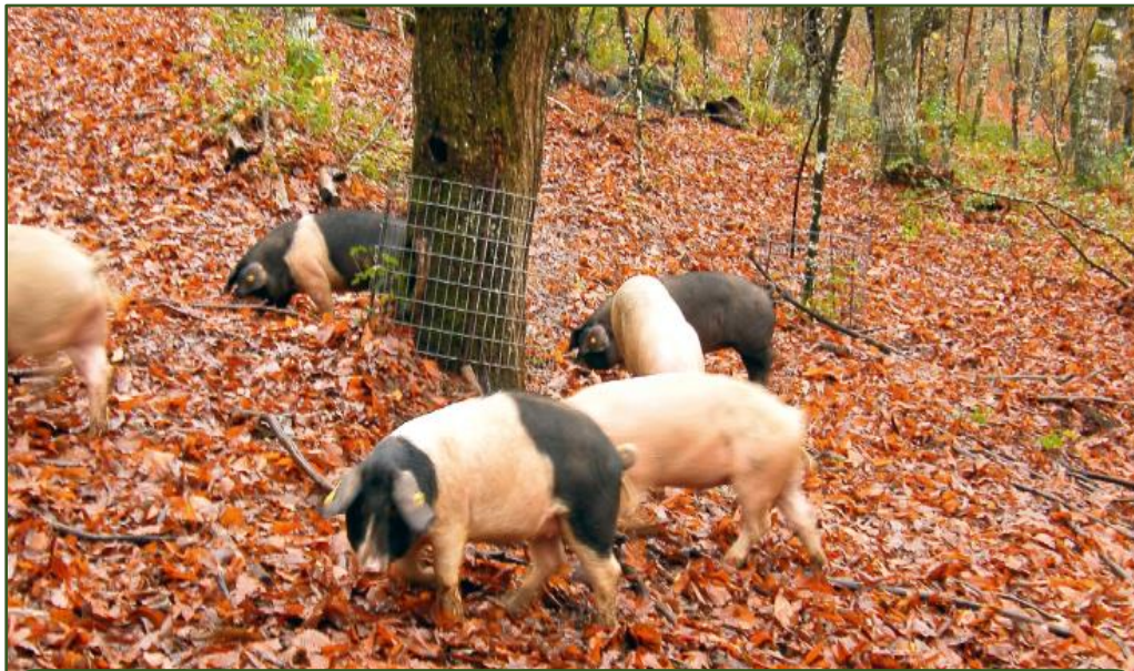
Ošípané v jesennej sezóne hľadajúce gaštany a iné krmivo (Španielsko)

Od rímskych čias sa ošípané pravidelne vyhánali do bukových a dubových lesov, aby sa živili žaludmi a bukvicami, a do sádov, aby sa nakrmili spadnutým ovocím.