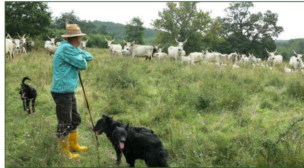
Pastier so svojim stádom na pastvine (Maďarsko)