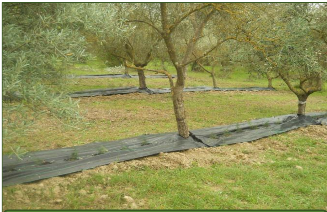
Olivy a špargľa (Taliansko, Veneto Agricola)

Obilniny, zelenina a krmoviny pestované medzi radmi olivovníkov alebo roztrúsenými olivovníkmi