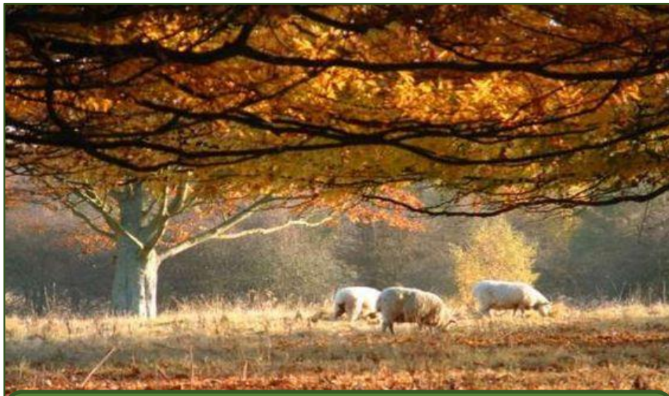
Ošípané pasúce sa v New Forest (Hampshire, Veľká Británia)

Jeden z najstarších poľnohospodárskych postupov, ktorý hrá dôležitú úlohu pri zvyšovaní biodiverzity a zachovávaní historických a kultúrnych hodnôt. Stromy poskytujú zvieratám úkryt, tieň a krmivo.