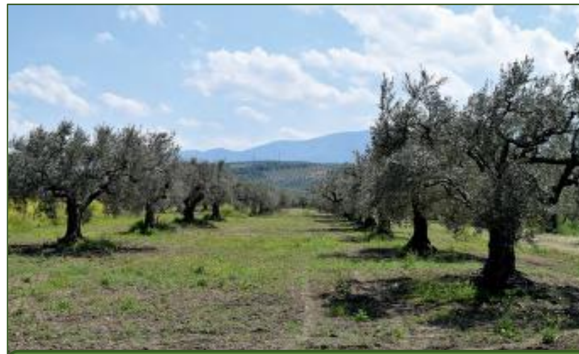
Olivy s cícerom pestovaným v medziradoch (Grécko)