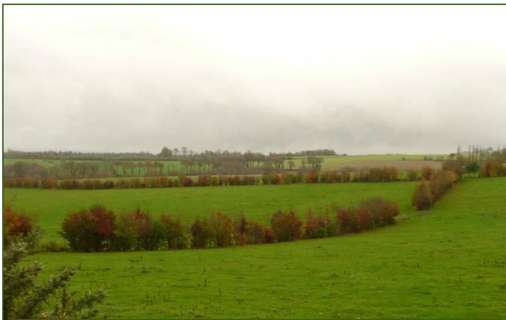
Agrolesníctvo „Bocage“ (Bretónsko, Francúzsko) (Zdroj: Thenail et al., 2014)

Ich úlohou je predchádzať erózii, poskytujú ochranu pred vetrom, úkryt a zdroj potravy pre zvieratá, drevo, potraviny a lieky. Slúžia ako historické ale aj súčasné hraničné línie, ako aj útočisko pre biodiverzitu a zelený koridor pre divočinu v poľnohospodárskych regiónoch.