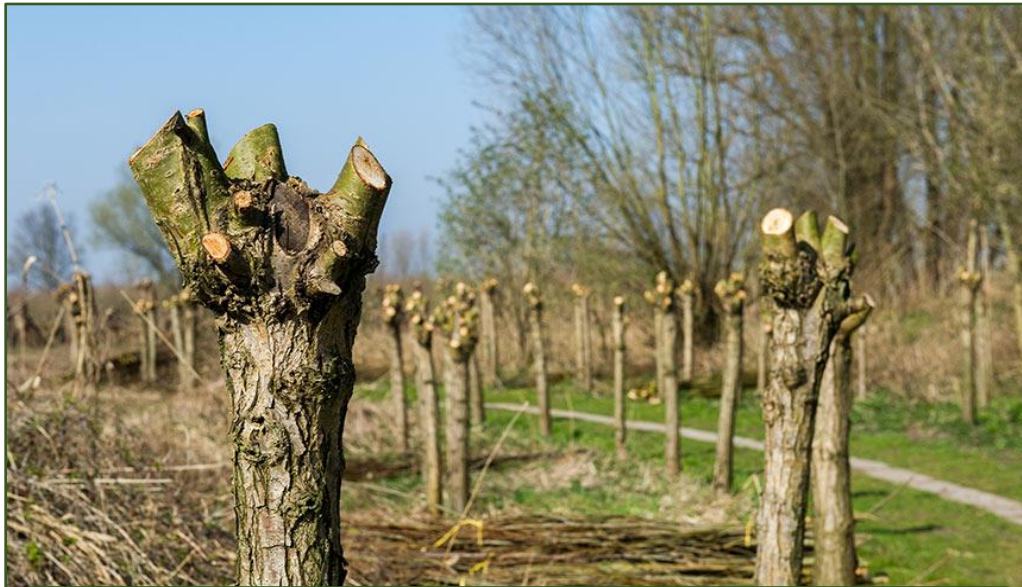
Zrezané stromy „na hlavu“ v severnom Francúzsku

Táto prax je tisícky rokov využívaná v celej Európe, pričom zvlášť bežná je v severnej Európe a v horských oblastiach. Pravidelné zrezávanie stromu "na hlavu" sa väčšinou vykonáva vo výške 2-3m s cieľom získať krmivo pre zvieratá a palivové drevo alebo drevo na ďalšie účely.