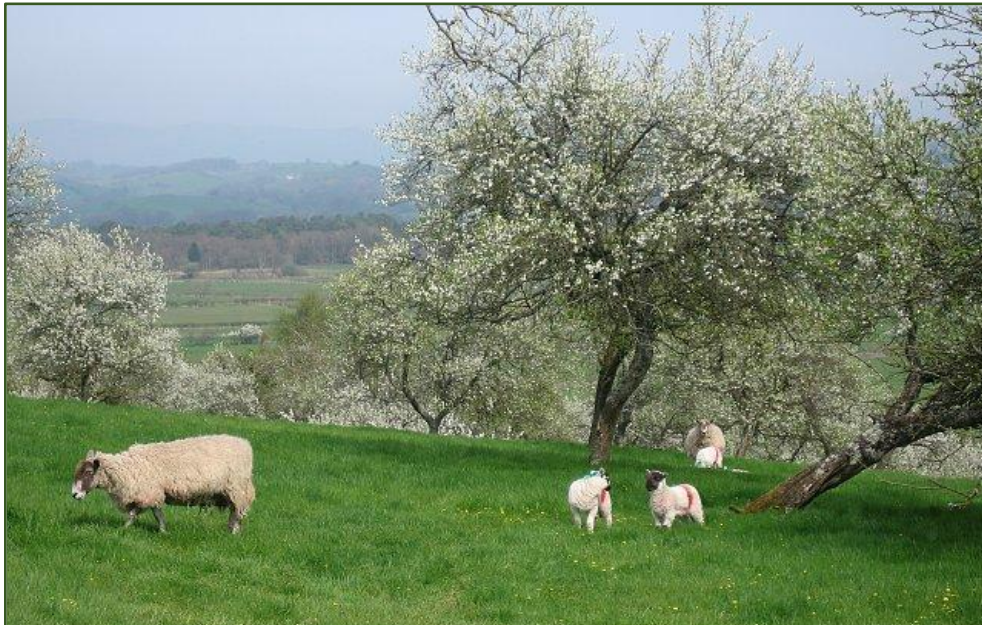
Boguards (Holandsko)

Sady ovocných stromov spásané alebo bez pasenia, v niektorých prípadoch sa medzi stromami pestovali poľnohospodárske plodiny. Názov tohto systému sa líši v závislosti od regiónu (napr. pré-verger, boguards, pomeradas, streuobst)