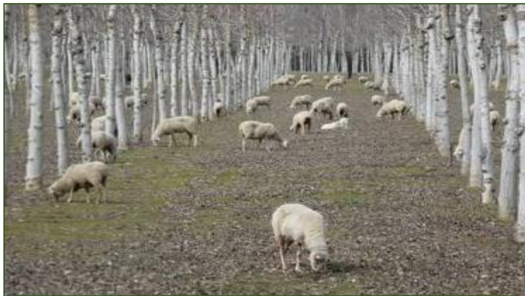
Pasená plantáž s orechmi (Španielsko)

Výsadba topoľov s medziplodinami alebo pastvou je potup známy už od 18. storočia. Dnes sa na poľnohospodárskej pôde pestujú cenné dreviny ako napr. čerešňa a orechy. Integrácia pastvy a medziplodín do týchto systémov má ekonomické a environmentálne výhody.