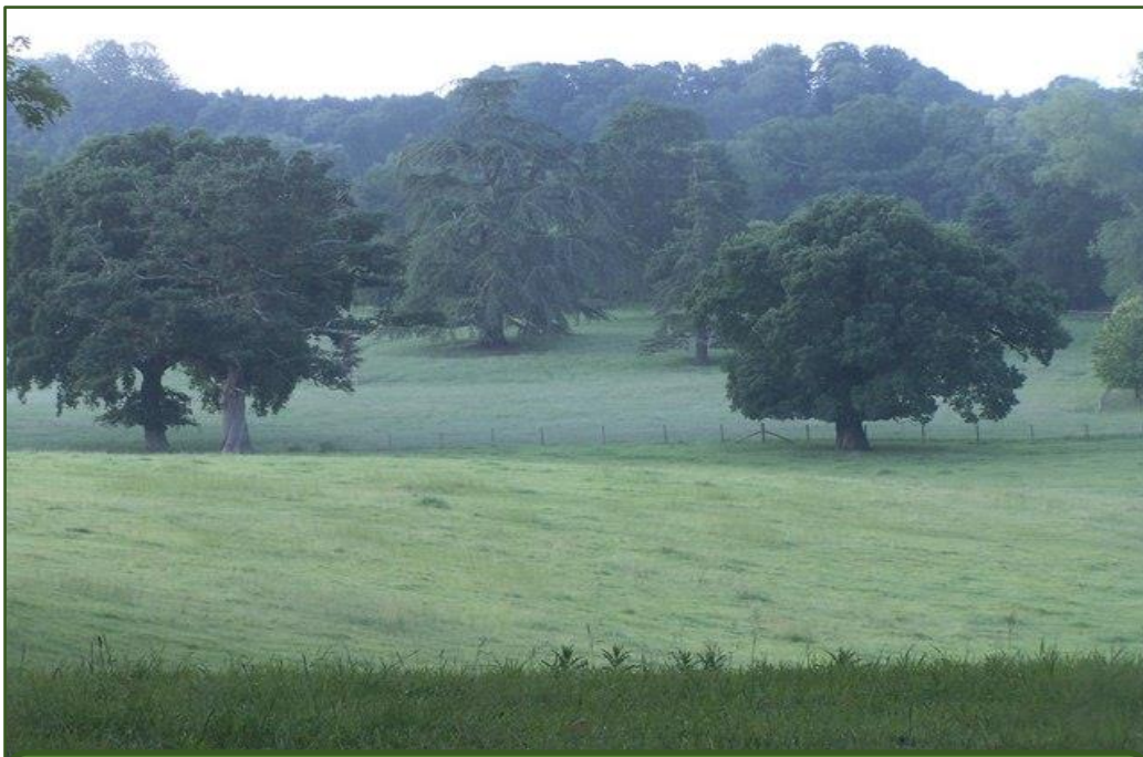
Park (New Forest, Veľká Británia)

Pôvodne založené na poľovnícke alebo estetické účely (18. storočie), neskôr však poskytovali aj drevo na stavbu lodí.