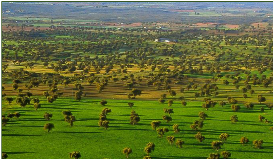
Dehesa (Extremadura, Španielsko)

Na zalesnených pastvinách v okolí Stredozemného mora - „Dehesa“ (Španielsko) a „Montado“ (Portugalsko) sa pod širokou sieťou rozptýlených dubov pasú ovce, kozy, ošípané a dobytok. Stromy poskytujú žalude, drevo, drevené uhlie a korok. Spásané lesy hrajú dôležitú úlohu pri prevencii lesných požiarov na stredomorskom vidieku.