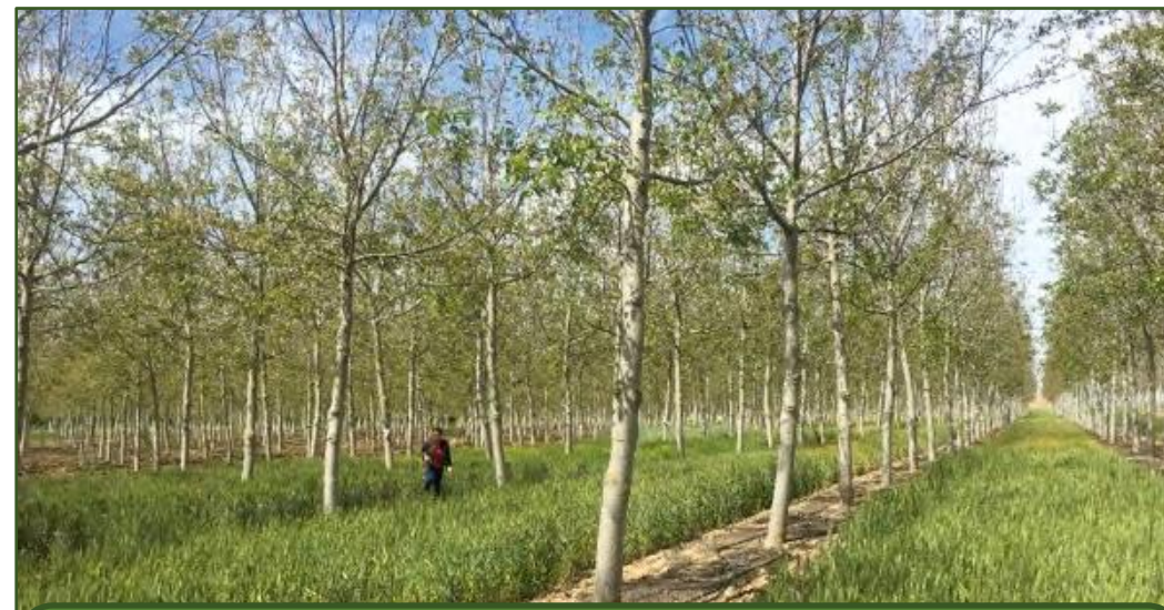
Testovanie rôznych kultivarov obilnín na orechovej plantáži určenej na produkciu cenného dreva (Bosques Naturales, Španielsko)