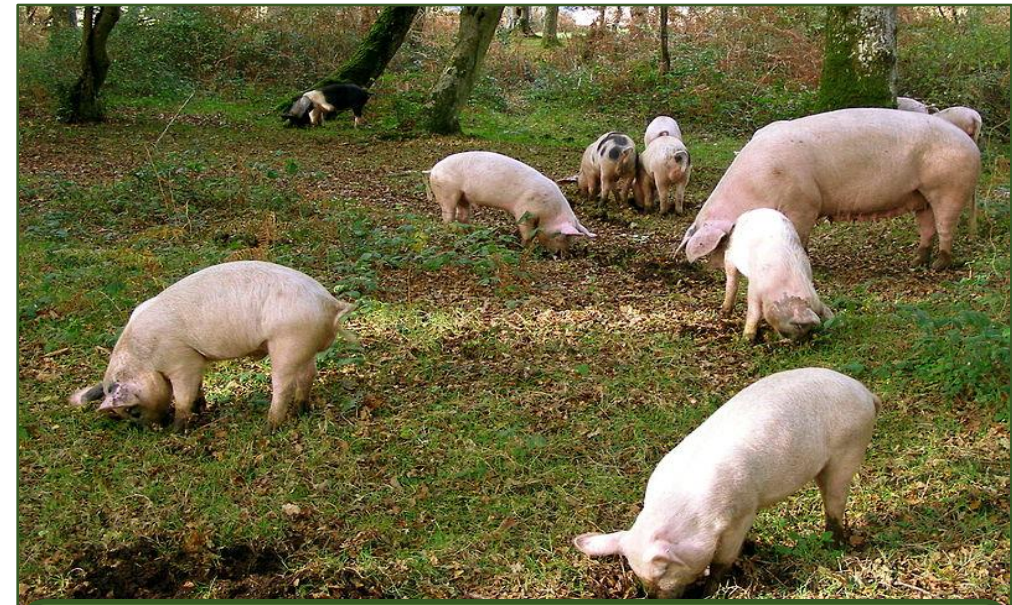
Moderné pasenie ošípaných v lese (New Forest, Veľká Británia)