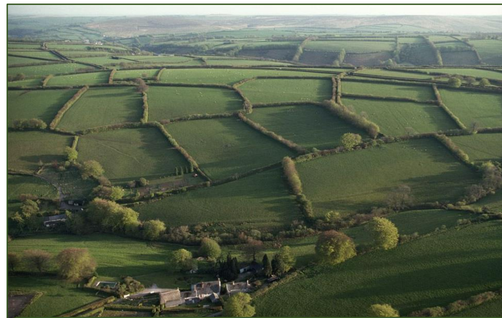
Systém živých plotov a remízok (Somerset, Veľká Británia)