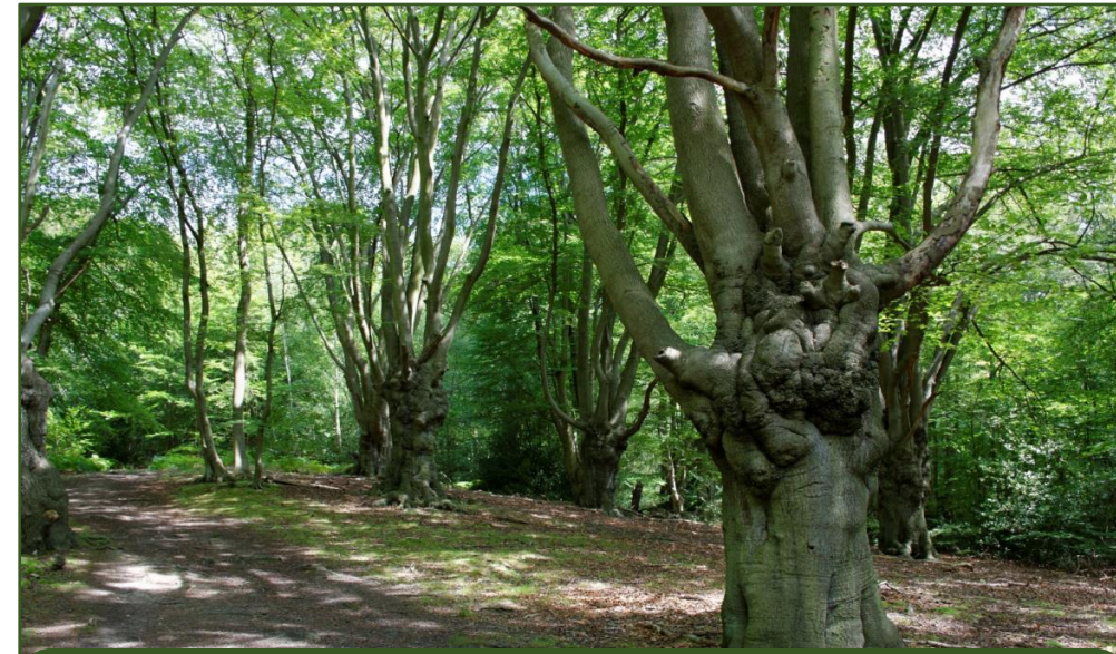
200 - 400 rokov staré zrezávané buky v Epping Forest (Veľká Británia)