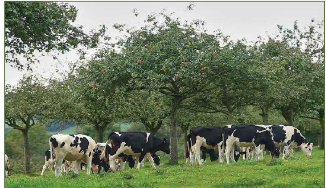
Pré-verger (Francúzsko) (Zdroj: Coulon and Pointereau, 2017; foto Éric Péro)