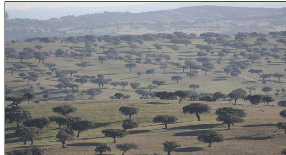
Montado (juhovýchodné Portugalsko)