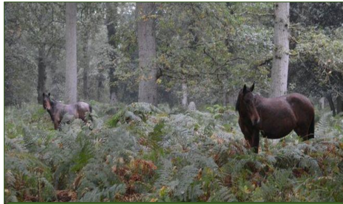
Pôvodní poníci v New Forest (Hampshire, Veľká Británia)