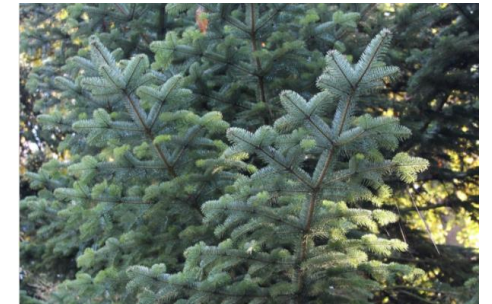
Abeto del Cáucaso