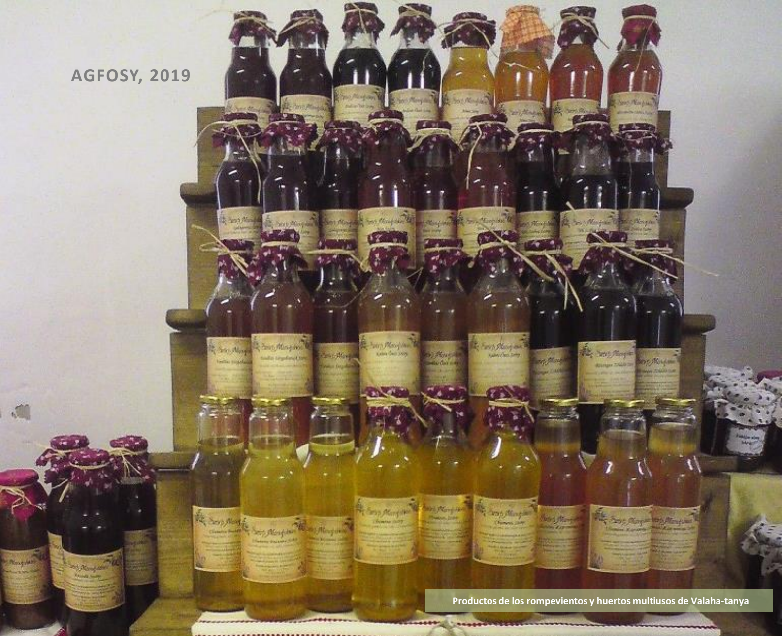
Productos de los rompevientos y huertos multiusos de Valaha-tanya