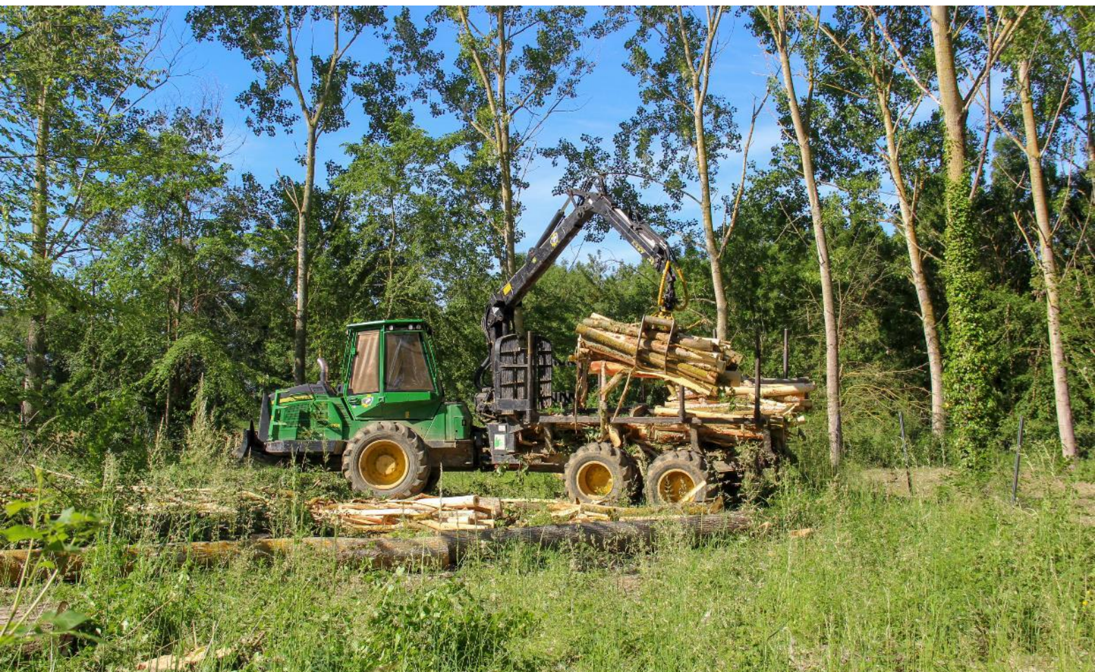
Nakladač při přesunu topolových klád

Alain Magnaut je francouzský farmář z regionu Gers. Rozhodl se přejít z tradičního lesnictví s topoly na silvopastorální agrolesnictví s drůbeží ve volném výběhu pod stromy.