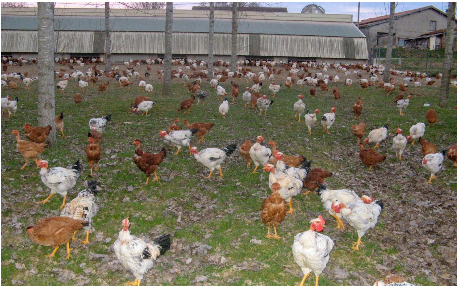
Kuřata ve volném výběhu pod topoly

Chov drůbeže o rozloze 2,5 ha je úspěšný, s dobře vyvinutými stromy a zdravými slepicemi pod nimi. Alain Magnaut také pěstuje plodiny v silvoorebném systému na 65 ha s různorodými druhy stromů.