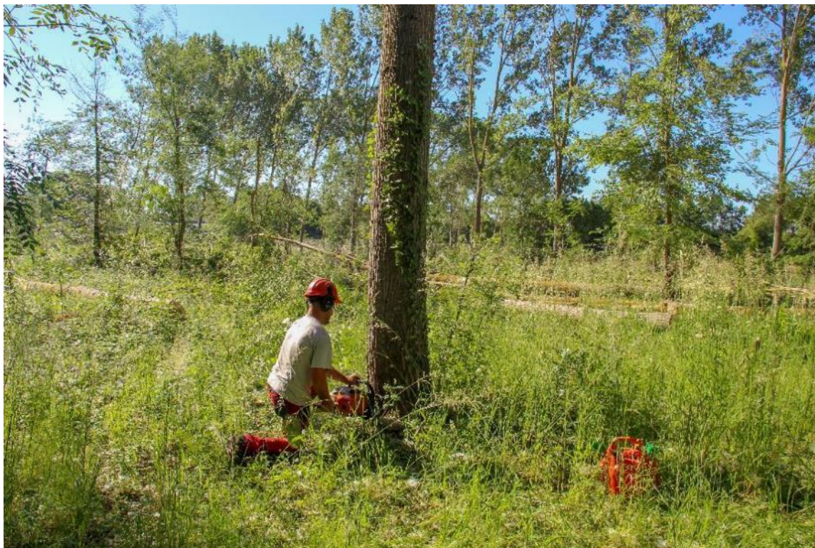
Ruční kácení topolů

Topoly byly pokáceny v roce 2018 a prodány za cenu průměrně 55 €/m 3 , což při celkové produkci 528 m 3 z 2,5 hektarového silvoorebného pozemku přineslo celkový zisk 29 040 €. Celkové náklady na péči o stromy dosáhly 5 462 €. Systém je tedy jasně ziskový.