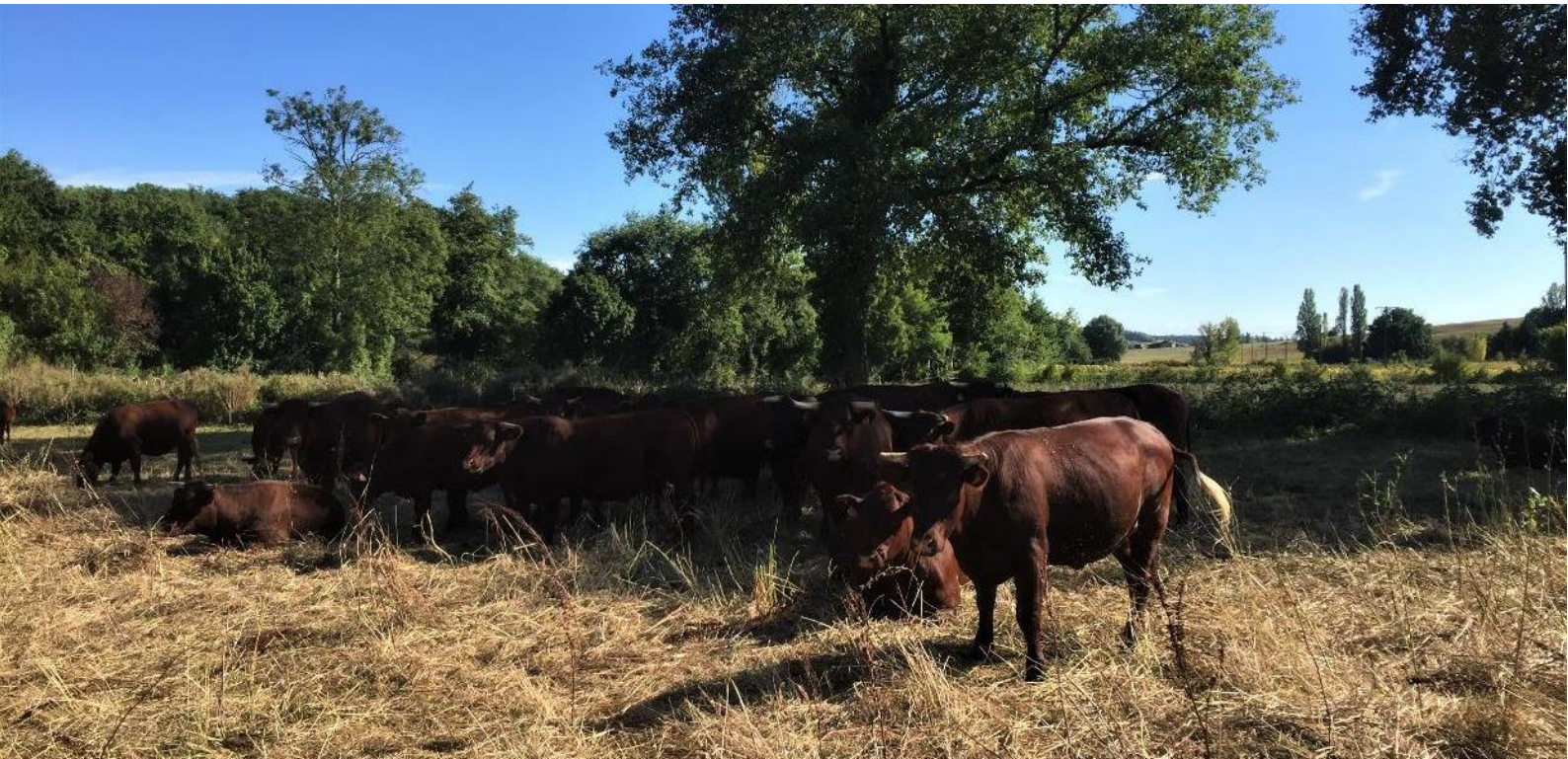
Kravy Red Sussex užívajúce si tieň