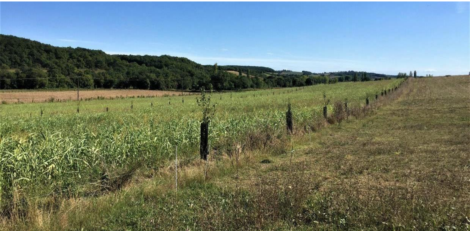
Celkový pohľad na agrolesnícky pozemok na ornej pôde na farme Naroques

Lesná záhrada bola vysadená spôsobom, ktorý predpokladal úzky vzťah medzi rastlinami, rešpektoval pôvodné vrstvy prirodzeného lesa a predpokladal sled jednotlivých druhov. To umožnilo vysadenie 11 druhov stromov (prevažne ovocných) v spojení s kríkmi a bobuľovým ovocím. Rady stromov sú od seba vzdialené 3 m a stromy majú rozostup 1 m. Medzi radmi stromov sú vysiate krycie plodiny alebo riadky zeleniny. Zelenina je tiež zasiata v radoch stromov. Táto veľmi hustá výsadba bude čiastočne udržaná vďaka intenzívnemu prerezávaniu. Pôda bola zoraná do hĺbky, ale to nebolo dostačujúce, takže pre každý strom (odrezok alebo sadenica) bola ručne vykopaná hlboká diera. Celý pozemok je chránený plotom.